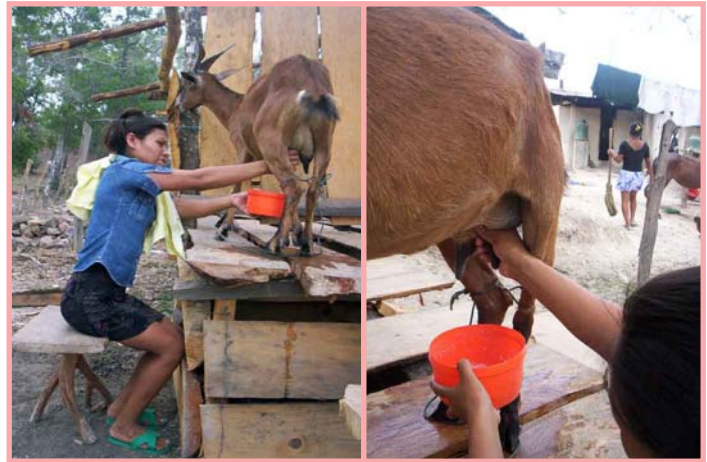
Area de ordeño acondicionada por productora de los Llanitos (Cusmapa)

El ordeño debe efectuarse en lugares tranquilos, sin la presencia de personas o animales extraños que asusten a la cabra. Procure no vacunar, ni inyectar medicamentos o recortar pezuñas, antes del ordeño.