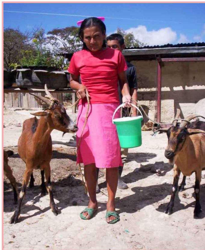
Productora de los Llanitos (Cusmapa) asegura 3 litros de leche diario, durante el verano.

Pero ¿Cómo lograr que los animales produzcan buenos rendimientos y no se enfermen?... En esta publicación se pretende brindar los elementos básicos en el manejo sanitario y reproductivo del ganado caprino criado en condiciones rústicas, específicamente para que los promotores, promotoras y personas que se dedican a la crianza de cabros tengan mejores resultados.