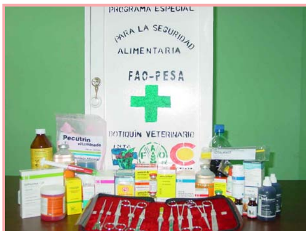
La comunidad debe contar con un botiquín veterinario para enfrentar cualquier problema de salud de sus animales.

7) Si se aplican medicamentos tomados (vía oral) y el animal está echado debemos pararlo, sujetarlo bien, esperar a que se tranquilice un poco, introducir los dedos por el borde de los labios para que abra la boca y al mismo tiempo, introducir la jeringa o la botella para verter el líquido y que lo vaya tragando poco a poco, percátese de no taponarle la nariz mientras hace esto.