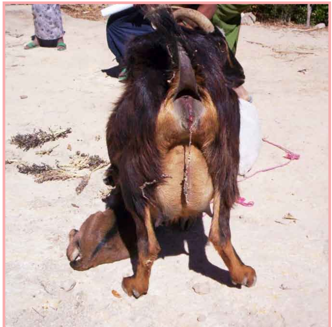
Toda cabra que aborta o para crías muertas deberá ser investigada.

Esta enfermedad se transmite al hombre. En las cabras provoca abortos, las pares se le quedan pegadas, pueden haber partos con nacimientos prematuros o de crías débiles que mueren poco tiempo después. Además hace que las cabras no se preñen normalmente y en los machos disminuye la capacidad de engendrar. Para conocer si un hato tiene la enfermedad, se aconseja hacer exámenes de sangre a todo el rebaño, si no salen animales positivos se repite la prueba a los 6 meses y si no salen positivos, la prueba seguirá haciéndose cada año.