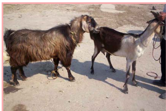
Cabra llevada al semental en Los Llanitos.

Es más frecuente que las cabras se encelen en los meses en que los días son más cortos (septiembre, octubre, noviembre y diciembre). Aunque en cabras bien alimentadas en nuestros países (tropicales) pueden embramarse en cualquier época del año.