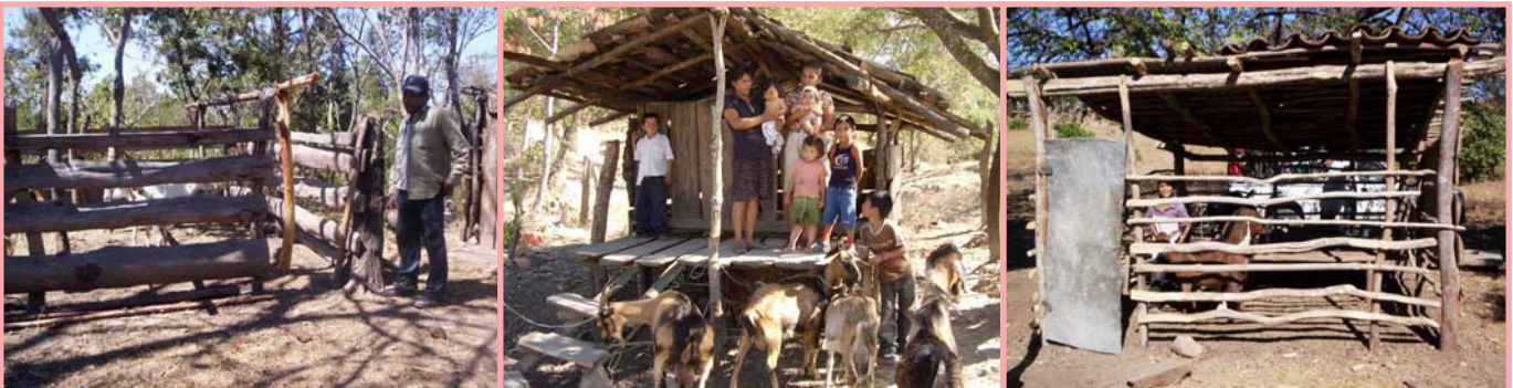
La facilidad de manejo de las cabras permite la integración de la familia.