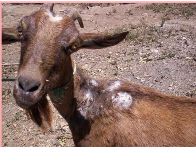
Cabra inquieta por presencia de tórsalos.

Interna: Los parásitos que más afectan a las cabras son las lombrices (parásitos redondos) y las solitarias o tenias (parásitos planos).