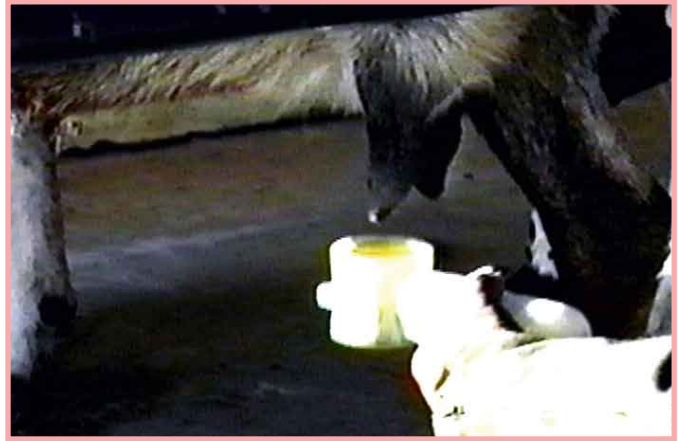
Desinfección final, elemento básico en la prevención de la mastitis.

Una vez terminado el ordeño a mano o de haber mamado la cría se aconseja meter cada pezón en un vaso con agua yodada. A un balde de 10 litros se le agregan 2 tapitas (10 cc.) de yodo puro. Esto sirve para desinfectar el pezón y evitar la mastitis.