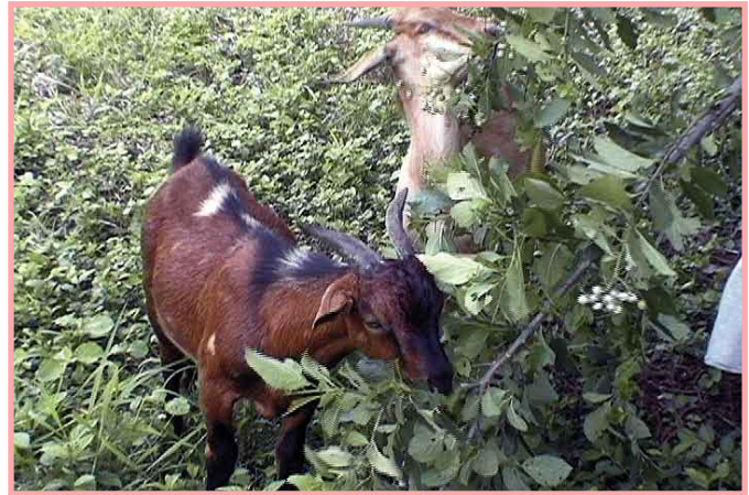
Las cabras prefieren el "Ramoneo".

A las cabras les gusta comer más las hojas y retoños en las ramas de los árboles o arbustos, que el pasto (son más ramoneadoras). Se ha demostrado que las cabras producen más leche y los cabritos engordan más cuando se alimentan con hojas de árboles o arbustos forrajeros en lugar de pastos. Se obtienen mayores rendimientos en la producción de leche y carne cuando se alimentan con ramas de morera, amapola, guías y hojas de camote, ramas de tigüilote, guácimo, chaperno, áramo, zarza, iril, piñuela, cardón, teonoste, entre otros.