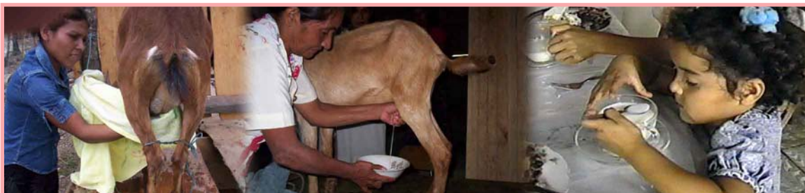
La higiene durante el ordeño garantiza leche de buena calidad para la alimentación de la familia.