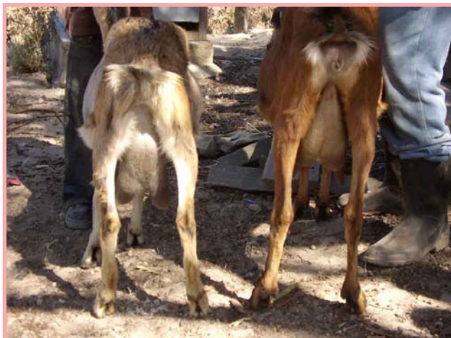
Las cabritas pueden salir preñadas a las 12 semanas de edad. Cabrita de la izquierda preñada antes de tiempo.

Maneje por separado las cabritas y cabritos ya que son capaces de aparearse y concebir a las 12 semanas de edad (3 meses). Las preñadas a temprana edad, además de presentar problemas al parir, producirán menos leche. Recuerde, es mejor que se preñen, cuando alcancen la edad y el peso adecuado.