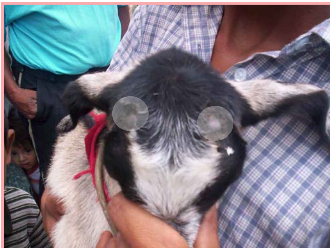
Al momento del descorne, aproveche para quemar las glándulas que provocan el olor característico de los cabros.