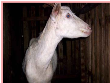
Cabra en celo que se encuentra intranquila.

Las cabras enceladas mueven mucho la cola, orinan a cada rato, se frotan con mayor frecuencia a otras cabras, a los cercos o a los palos; balan mucho más de lo usual. Mientras las otras cabras comen con apetito, las enceladas no muestran interés por comer, algunas intentan montar a las demás, la vulva se les agranda, se les mira más rosadita y con secreciones transparentes, las que hacen que se peguen los pelos de la cola.