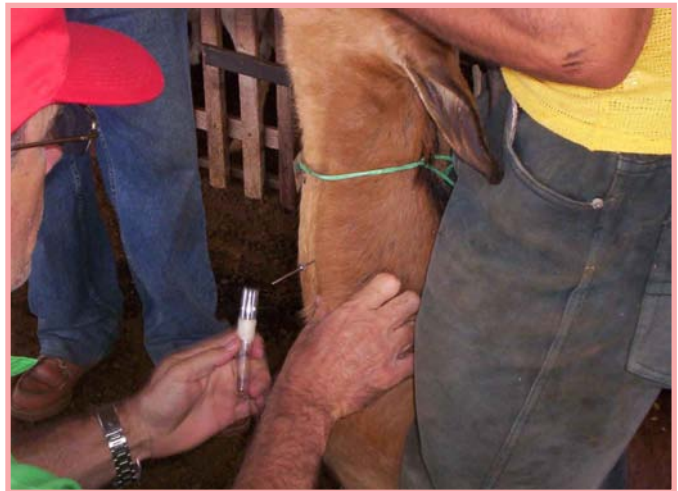
Muestra de sangre para la prevención de la brucelosis.

La mastitis también puede evitarse curando las heridas, rasguños y golpes en la ubre o los pezones. A las cabras que se dejen de ordeñar, se recomienda aplicarles candelas para secado, las cuales tienen antibióticos, que permanecen mucho tiempo en el pezón y evitan que cuando empiece a producir leche de nuevo aparezca la mastitis.