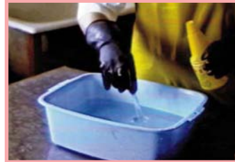
Lave con agua yodada.

Lave siempre los pezones, aunque parezcan limpios. Si está a su alcance, lave la ubre con agua tibia y a la vez súbela. Esto estimula la bajada de la leche, pero luego seque los pezones antes de comenzar a ordeñar. Si rasuramos los pelos de la ubre y de sus alrededores se facilitará su limpieza.