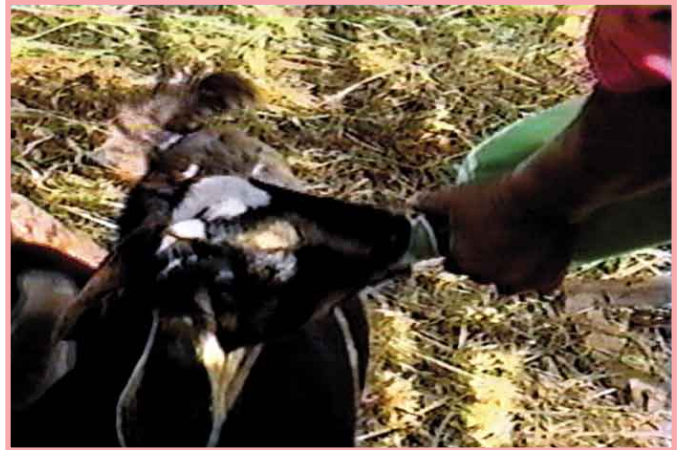
Aunque consuman otros alimentos, la leche sigue siendo el alimento básico.

Los cabritos recién nacidos deben dejarse con la madre todo el tiempo durante 3 ó 4 días (mientras más, mejor), para que mamen la mayor cantidad posible de calostro.