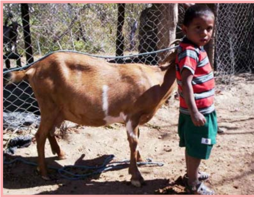
Cabra productora de 3 litros de leche en dos ordeños. Comunidad El Obraje, Villanueva.