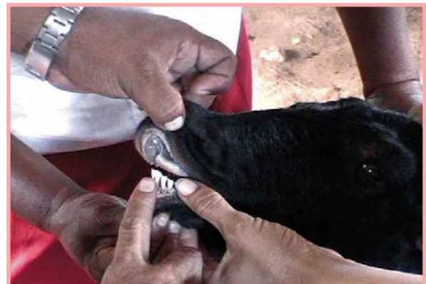
La edad se calcula por la muda y el desgaste de los dientes.