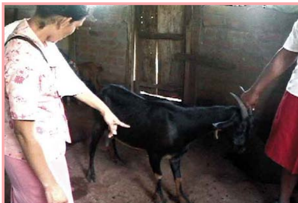
Examine bien la cabra antes de comprarla.

Compre o intercambie animales que tengan pruebas de brucelosis y otras enfermedades contagiosas. Si se traen animales de otro lugar manténgalos separados durante un tiempo (40 días como mínimo) observándolos si se enferman o no, antes de mezclarlos con el rebaño.