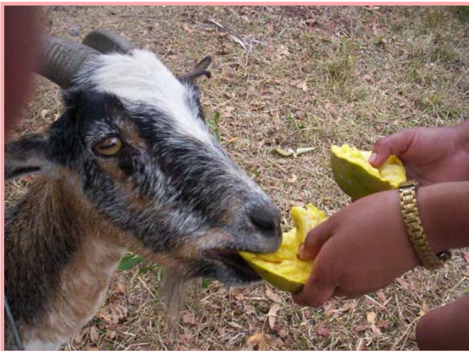
Las cabras también aprovechan las frutas.

Las cabras que están dando leche son los animales a los que más hay que alimentar.