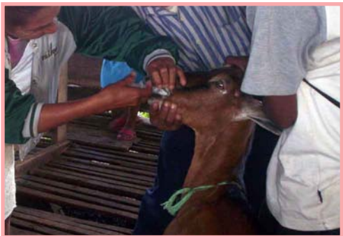
Capacitar promotores permite a la comunidad la sanidad de sus animales.

Existen purgantes (antiparasitarios) como el Albendazol o el Panacur que matan a estos dos tipos de parásitos. Para que los parásitos no hagan daño se recomienda mantener limpio los establos, evitar la humedad en los alrededores de los comederos y bebederos, y no utilizar el estiércol como abono en los potreros donde pastan las cabras.