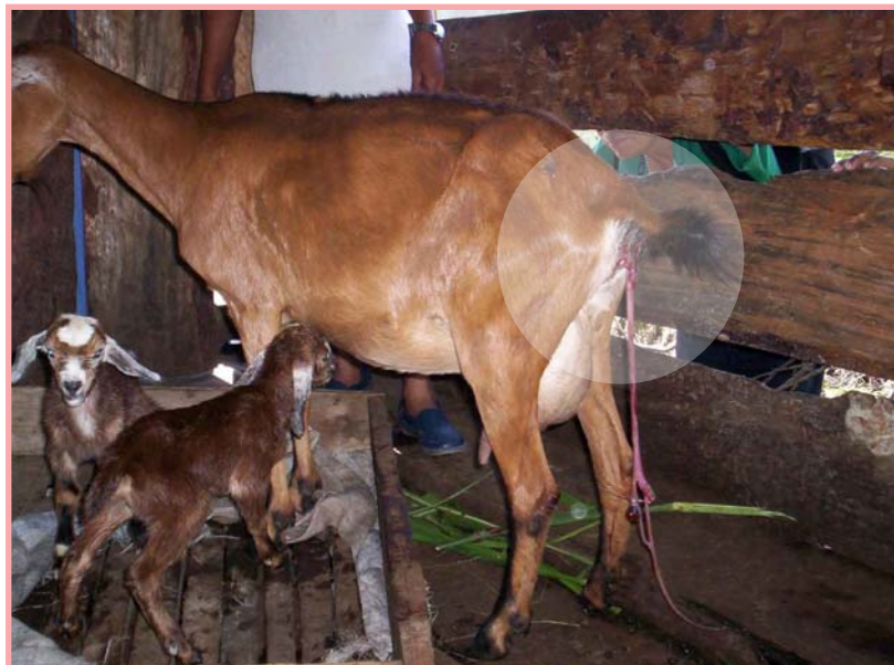
Cabra recién parida que aún no ha expulsado la placenta.

El secado se hace más rápido si al mismo tiempo se le reduce la ración de comida y agua por 1 ó 2 días de modo que no afecte la preñez. Cuando dejamos de ordeñar a las cabras que queremos secar debemos mantenerlas lejos de los lugares donde se ordeñan, esto hace que se le pase el estímulo de producir leche.