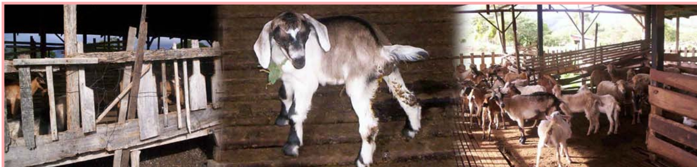
Pésimo mantenimiento de los establos, cabrito con diarrea, mezcla de animales y exceso de estiércol en los corrales.