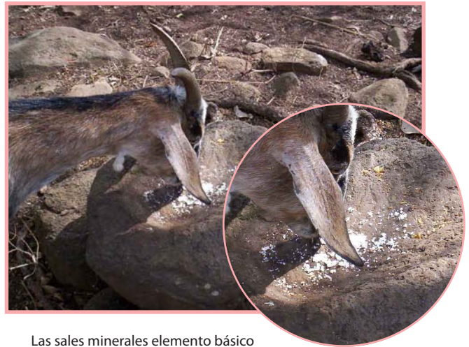
Las sales minerales elemento básico en la dieta de las cabras.

Externa: Se realiza mediante baños quincenales o mensuales con productos que maten a las garrapatas, los tórsalos, piojos y otros insectos.