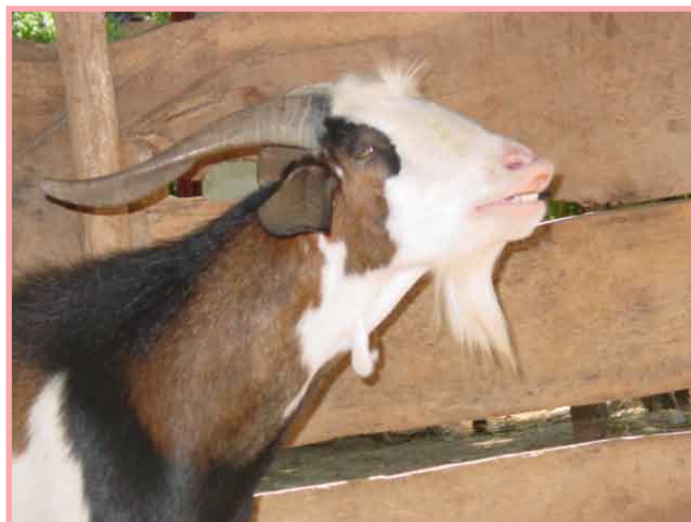
Semental manifiesta deseo por la hembra.

Después de las cabras, que están dando leche, el semental es el segundo animal del hato, que debe ser alimentado con mucha dedicación. No debe faltarle el agua, sales minerales, vitaminas, desparasitantes y sobre todo las pruebas de brucelosis.