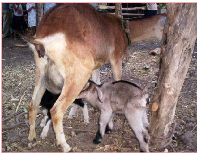
Permanecer juntos los primeros días después del parto, garantiza mayor protección para las crías.

Se aconseja ordeñar un poco de cada "teta" para aliviar la presión de la ubre.