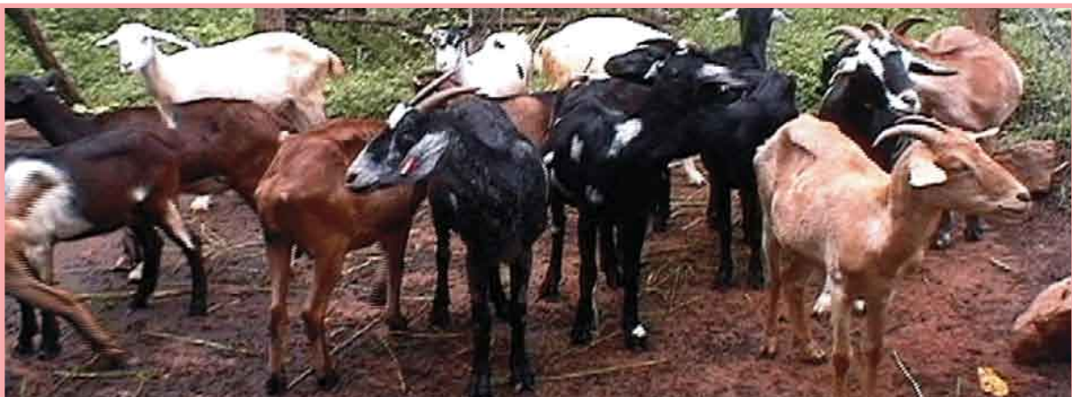
En los pisos de tierra se acumula la orina y excrementos que son refugio de enfermedades.

Las cabras no deben mojarse ni tampoco asolearse. La lluvia les causa enfermedades respiratorias, de la piel y de las pezuñas. Las radiaciones solares en exceso bajan la producción de leche y hacen que las cabras que fueron cubiertas pierdan la cría. En los machos, pueden presentarse dificultades para preñar.