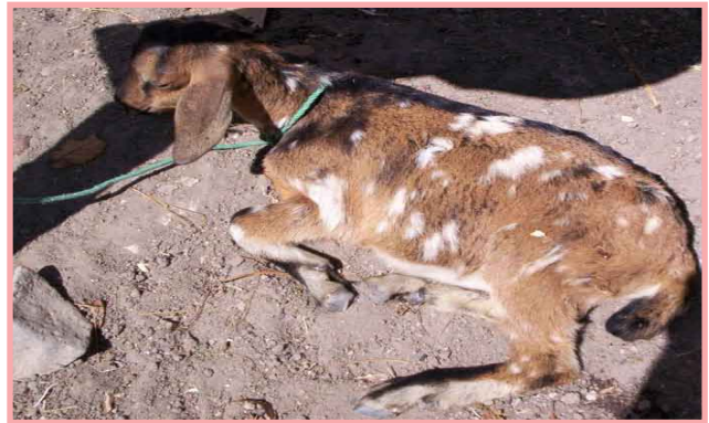
Cabrito con signos de parasitismo.

Se cree que a todos los animales, incluyendo la cabra, no les perjudica el consumo de agua sucia. Esto es un error, porque el agua sucia, además de provocar enfermedades, tiene mal sabor, esto hace que el animal tome menos agua y baje su producción. A las cabras debe dárseles agua limpia y fresca (potable).