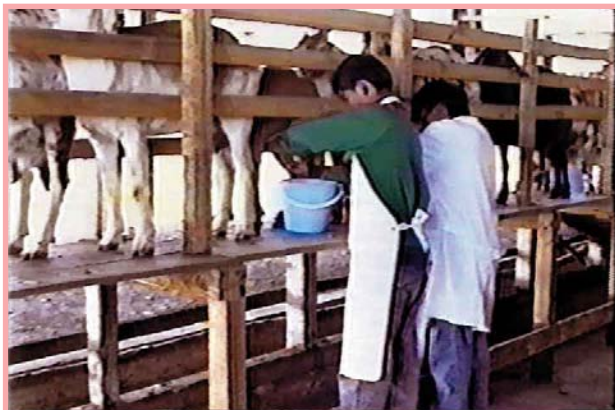
Ordeño más tecnificado.

Debe ordeñarse por los lados de la cabra ya que es más higiénico. No se debe embarrar de leche los pezones porque esto atrae a las moscas y junto con ellas los microbios.