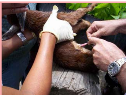
Recuerde curar el ombligo todos los días.

El consumo de calostro asegura la protección al cabrito contra muchas enfermedades ya que actúa como una vacuna que lo protege hasta que se desarrollen sus propias defensas.