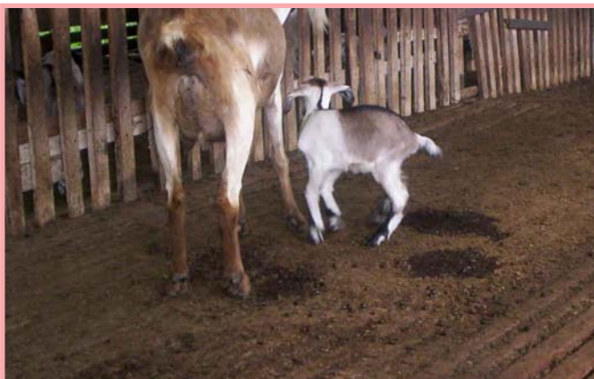
La suciedad facilita la aparición de enfermedades y parásitos.

Las aguas estancadas son lugares donde se refugian los microbios y se reproducen los zancudos, moscas y cucarachas transmisores de enfermedades.