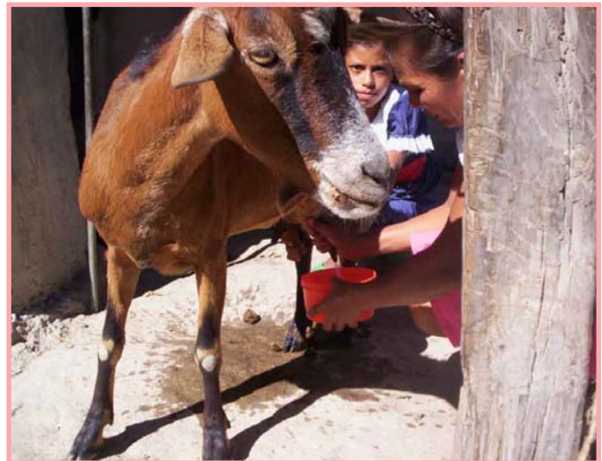
El lavado de la ubre estimula la bajada de la leche.

Lave siempre los pezones, aunque parezcan limpios. Si está a su alcance, lave la ubre con agua tibia y a la vez súbela. Esto estimula la bajada de la leche, pero luego seque los pezones antes de comenzar a ordeñar. Si rasuramos los pelos de la ubre y de sus alrededores se facilitará su limpieza.