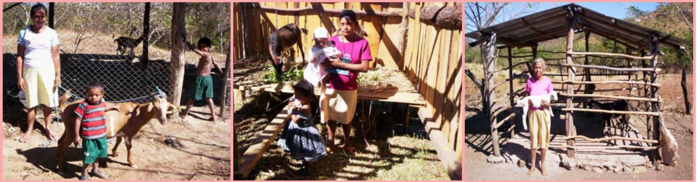
Varios diseños rústicos e instalaciones para cabras en Cusmapa y Villanueva.

Esto se hace para mantener aislados a los animales enfermos, facilitar su tratamiento y recuperación o para chequear los animales recién comprados antes de mezclarlos con el grupo.