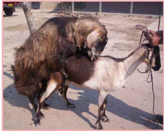
Se debe llevar la cabra al semental a los 21 ó 23 días después de la monta para comprobar si fue preñada.

Para asegurar la preñez se recomienda: si comienza a encelarse en la mañana, llévela al semental ese mismo día en la tarde y si entra en celo en la tarde, llévela al día siguiente en la mañana.