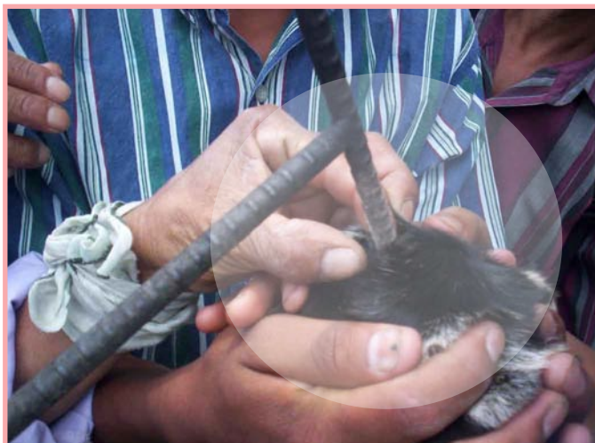
El descorne evita daños en el futuro, tanto para las cabras como para las personas que las manejan.