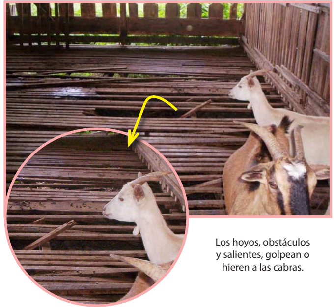
Los hoyos, obstáculos y salientes, golpean o hieren a las cabras.

Estos provocan heridas y golpes que pueden volverse graves en dependencia del sitio del cuerpo donde se produzcan. Asegúrese de que no queden clavos libres, astillas de madera o alambres en los pasillos.