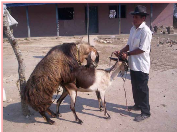
La monta controlada es el método más aconsejable para la reproducción de cabras en las comunidades.

En ésta, los sementales se mantienen solos en los corrales y cuando la cabra se encela es llevada para que sea enrazada. Este método es el más indicado para las comunidades ya que garantiza la probable fecha de parto y la debida atención a la cabra y a las crías, en el momento que se produzca.