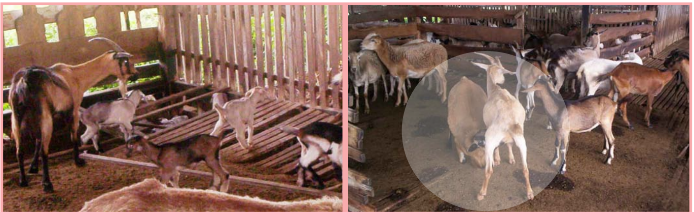
Mezcla de diferentes razas y mal estado de las instalaciones. Nótese un pelibuey adulto mamando la leche de una cabra parida.

La cabra es una de las especies domésticas que más defiende su jerarquía, es decir, hay unas que se imponen sobre otras y por lo general lo hacen violentamente. Cuando el espacio donde están se reduce, aumenta entre ellas la conducta agresiva.