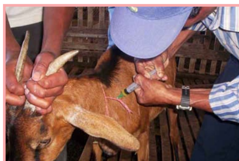
El promotor es el veterinario de la comunidad.

La vitamina más necesaria es la “AD 3 E”. Se recomienda aplicar a las cabras gestantes y recién paridas. Al resto del hato, a la entrada y salida del invierno.