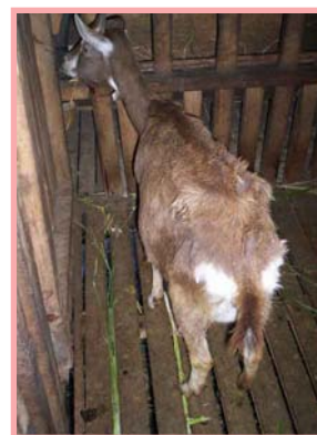
Cabra con mastitis crónica. Nótese su mal estado.

Sin registro no hay control de nacimientos, montas y partos, por lo que no sabremos si una cabra está gestante o no, ni podemos ayudarla a parir si lo necesita, no se sabe cuando desparasitar y vitaminar, ni cuanto se va a producir.