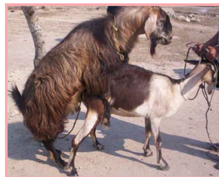
Servicio de semental en la comunidad de Los Llanitos.

Otro método que puede utilizarse es frotar un paño limpio y sin otros olores por las glándulas del almizcle o por detrás de las patas delanteras donde el semental se orina. Luego colocar este paño en un recipiente cerrado y destaparlo delante de la cabra, si trata de meter el hocico en el frasco, estará lista para la cópula. Si se piensa que dentro de un grupo hay varias cabras en celo, el trapo puede colocarlo por donde pasan las cabras o donde está el grupo, las que se dirijan hacia el trapo serán las que están embramadas.