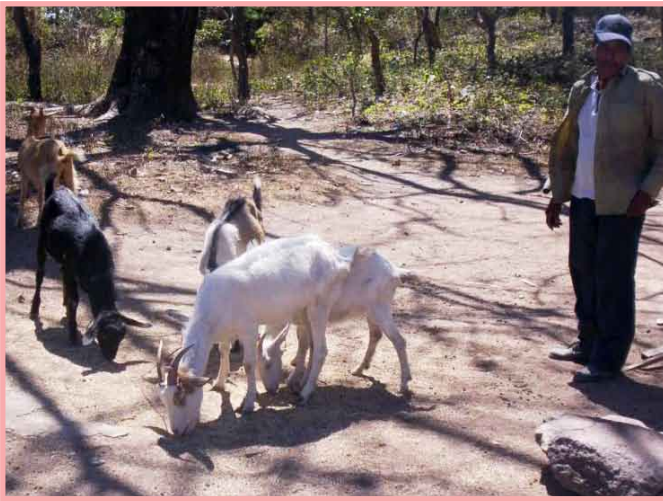
La crianza a intemperie predispone a enfermedades.