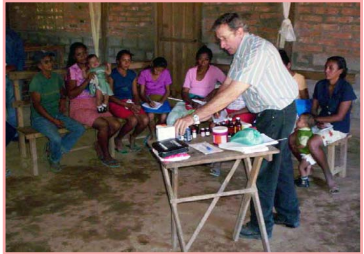
La comunidad también debe contar con personas capacitadas para curar a sus animales.

8) Los sueros vitaminados que contienen calcio, si se inyectan por la vena, deberán aplicarse lentamente, siempre mirando la reacción del animal, es decir, si se agita, se mira como inquieto o desesperado. Si no se tiene práctica por esta vía debemos de leer si el suero puede aplicarse por vía subcutánea (debajo del cuero) y aplicar la dosis en varios puntos (no más de 20 cc).